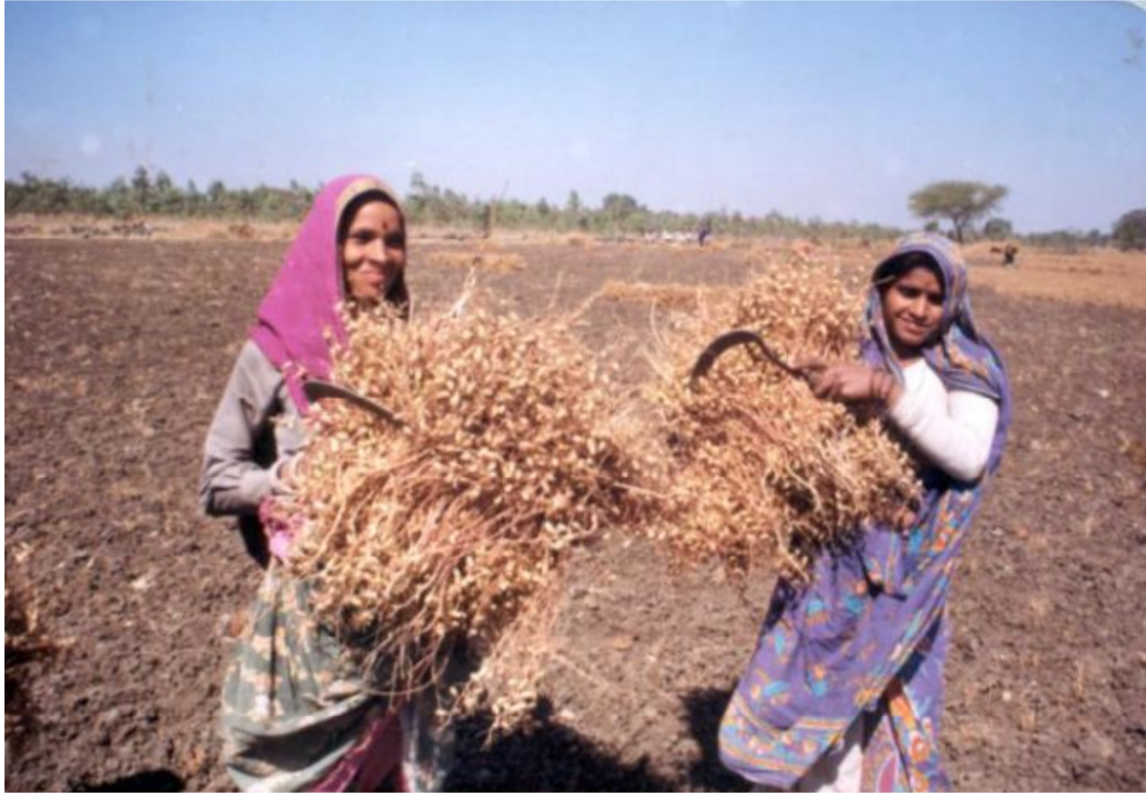
राखासुमि की मदद से